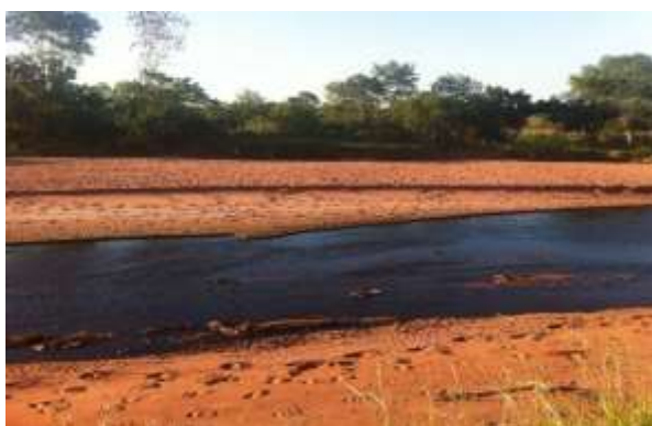
Figura 6a: área de pastagem

Fonte: Kelly Fernanda Queiroz, mar. 2016.