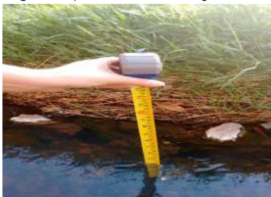
Figura 3a: profundidade do córrego

Fonte: Kelly Fernanda Queiroz, mar. 2016.