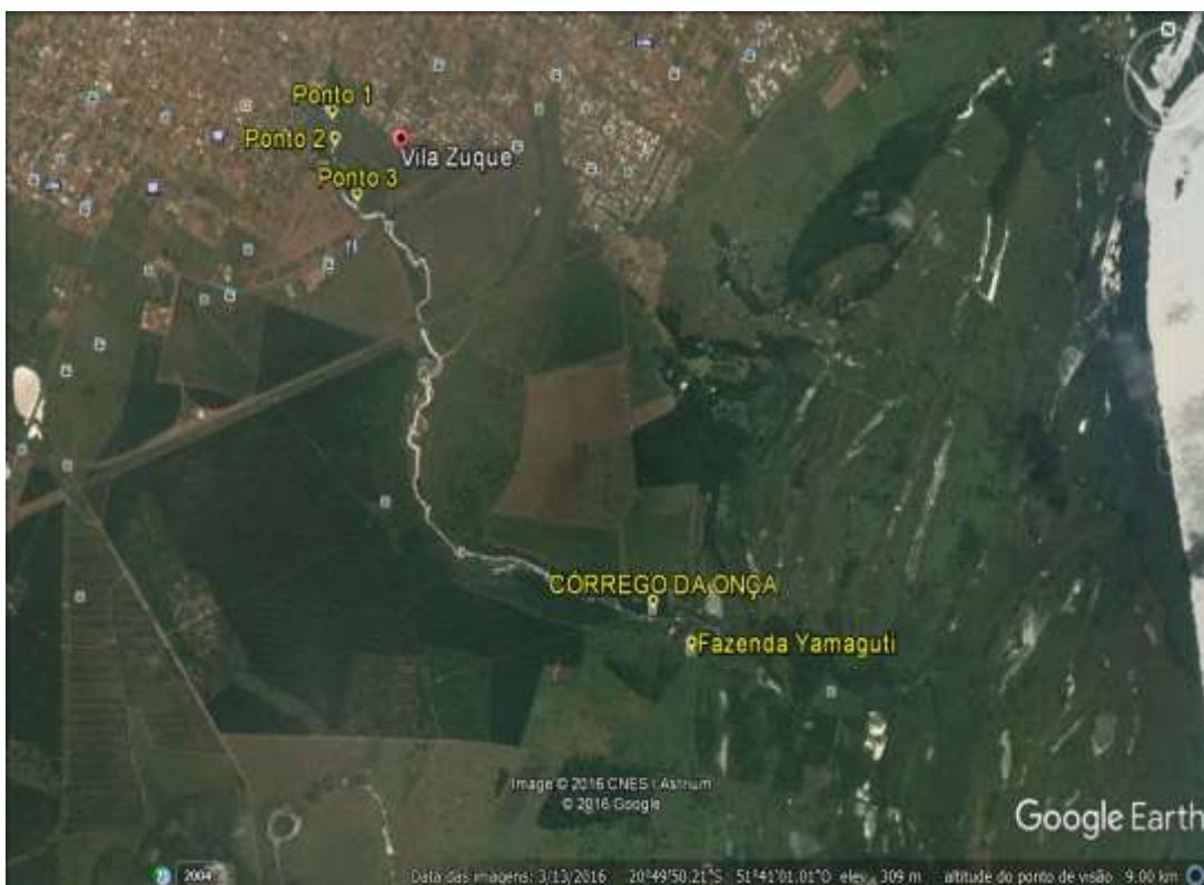
Figura 2. Localização da Bacia Hidrográfica do Córrego da Onça – Três Lagoas/MS.