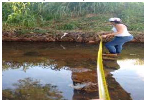
Figura 3b: largura do córrego