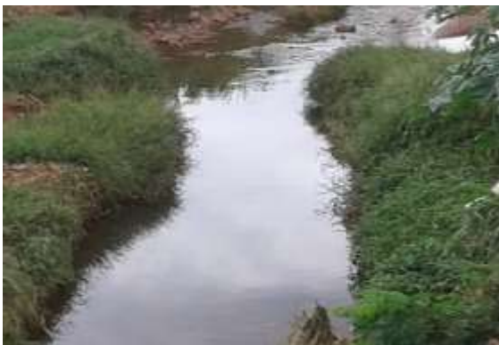
Figura 4a: Tipo de ocupação das margens