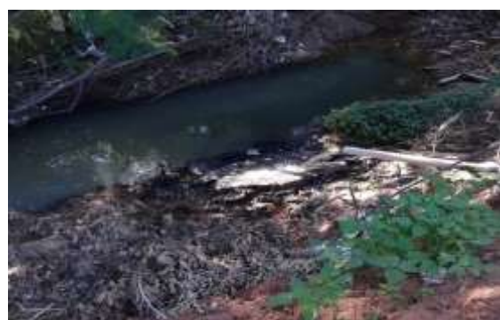
Figura 5b: contaminação por esgoto doméstico