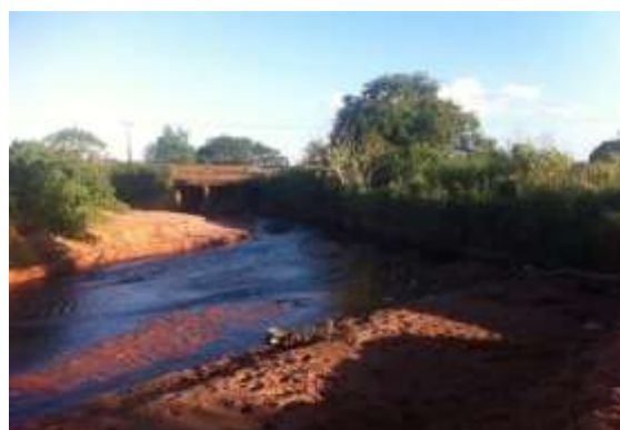
Figura 6b: Mata ciliar

Fonte: Kelly Fernanda Queiroz, mar. 2016.