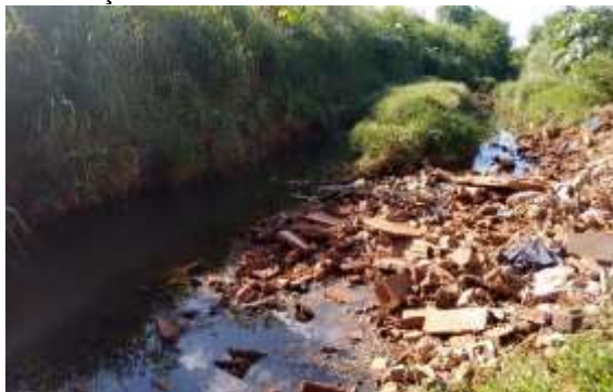
Figura 5a: contaminação por entulhos de construção civil

O ponto 2 sofre com várias alterações antrópicas, seja por lixo urbano, entulhos de construção civil, por esgoto doméstico, ausência de vegetação nas margens, enfim, afetando diretamente na qualidade do habitat. Este ponto também foi classificado como “impactado”. Demonstrado nas figuras 5(a) e 5(b).