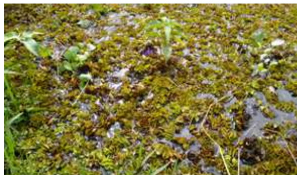
Figura 3: Presença de bioindicadores