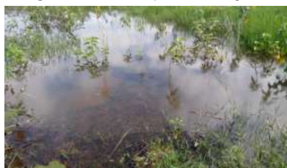
Figura 5: Oleosidade presente na água