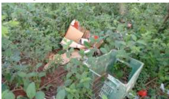
Figura 4: Presença de lixo na lagoa