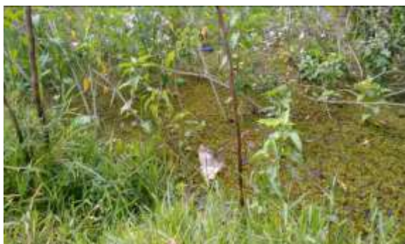
Figura 2: Alterações antrópicas

O crescimento demográfico da cidade de Três Lagoas-MS reflete em sérios problemas ambientais, como a Terceira Lagoa que se localiza no centro da cidade em uma área residencial, assim favorecendo a presença de lixo e esgoto doméstico que é evidenciado pela coloração turva da água, presença de odor e oleosidade (Figuras 2, 4 e 5). De acordo com os dados cadastrados e observados no Quadro 1, identificou-se alteração antrópicas.