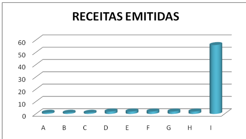
Gráfico 3: Prescrições do antidepressivo Citalopram 10 mg, de acordo com as receitas dos profissionais da área médica. Profissionais A, B e C correspondem a uma receita emitida (1,44%), profissionais D, E, F, G, H correspondem a duas receitas emitidas (2,88%), e profissional I, correspondem a cinquenta e seis receitas emitidas (81,28%).