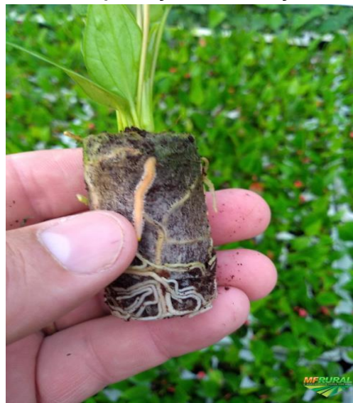
Figura 2. Fibra de coco apresentando bom enraizamento na produção de hortaliças.

A casca de coco ou fibra de coco (Figura 2) é um material orgânico, tem propriedades mecânicas específicas, biodegradabilidade, baixo custo em relação a outros aditivos disponíveis no mercado, é também muito resistente a fungos e podridão, é muito favorável para um isolante térmico, não absorve umidade, é a prova de traças, possui ação retardadoras de chamas e é a fibra mais dúctil entre todas as fibras naturais.