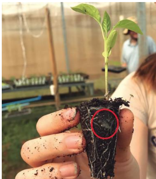
Figura 1. Muda vigorosa de pimentão produzida com adição de hidrogel nanocompósito ao substrato.

aquele que proporciona uma boa retenção de água (Figura 1) que se faz suficiente para a germinação e desenvolvimento da planta (SMIRDELLE et al., 2000). O substrato deve possuir baixa densidade, possuir vários nutrientes para a planta, possuir compostos químicos e físicos uniformes, uma elevada CTC, possuir uma boa capacidade de retenção de água, aderência junto as raízes (MENEZES, 1997; PONTES, 1996; LYRA, 1997; CALVETE et al., 2000). Além disso, é importante que seja de baixo custo e que diminua o tempo da planta no campo, os substratos têm que possuir suporte físico, químico e biológico para as plantas (CUNHA et al., 2006) resultando em mudas mais resistentes as condições climáticas (DUARTE et al., 2010).