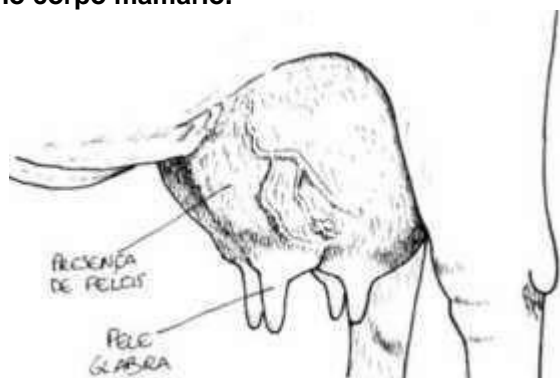
Figura 1. Glândula mamária de bovinos, observando a pele glabra nos tetos e os pelos no corpo mamário.

distribuídas de forma bilateral, simétricas e paralelas à linha mediana ventral do tronco (BRAGULLA; KÖNIG, 2014), além de que cada conjunto de glândulas é constituído por um corpo glandular e um teto, sendo que o teto é recoberto por pele glabra e no corpo mamário há presença de pelos (Figura 1) (DAVIDSON; STABENFELDT, 2008). Histologicamente, a glândula mamária é classificada como uma glândula sudorípara exócrina modificada, tubuloacinosas compostas com tipo secretor holomerócrino ou apócrino, separadas por tecido conjuntivo (FEITOSA, 2008).