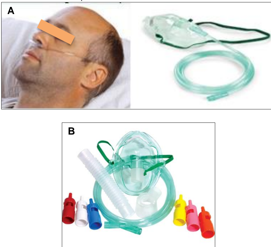
Figura 1. Dispositivos para aplicação de oxigenoterapia. A. Dispositivo de baixo fluxo. B. Dispositivo de alto fluxo.

dificuldade respiratória, em que a pessoa passa a fazer um esforço cada vez maior para inspirar e expirar o ar; a parestesia, que consistem em uma sensação de dormência nas extremidades do corpo, como mãos e braços, pés e pernas; a dispneia, caracterizada por respiração rápida e curta, semelhante à de pessoas com doença cardíaca; inquietação, caracterizado pelo estado de desassossego e agitação, sintoma similar ao de pessoas com ansiedade; fadiga, que é a sensação de enfraquecimento no esforço físico, cansaço em mínimos movimentos do corpo; tontura e mal-estar, caracterizados pela sensação de falta de equilíbrio e vertigem, indisposição ou perturbação desagradável, uma aflição não definida (SILVA; NEVES; FORGIARINI, 2021).