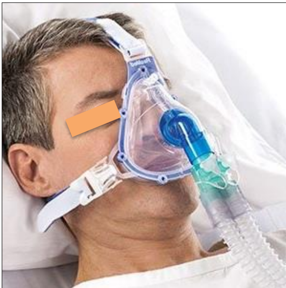
Figura 3. Ventilação não invasiva.