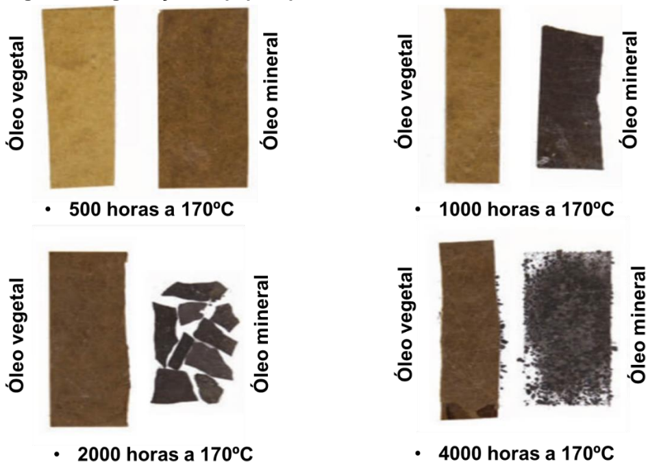
Figura 2. Degradação do papel tipo Kraft imerso em OVI E OMI.

(170 °C) em OVI e OMI por horários variados, demonstram que a celulose envelhece mais lentamente quando imersa em OVI do que quando imersa em OMI (Figura 2).