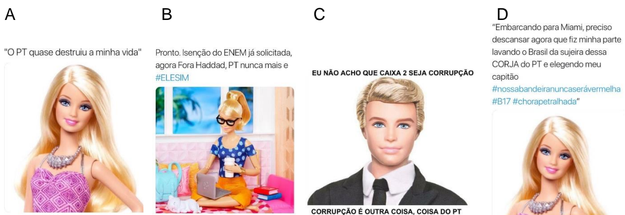
Figura 7. Memes selecionados para análise no percurso gerativo de sentido. A. Meme 01. B. Meme 02. C. Meme 03. D. Meme 04.

compartilhamentos. É a publicação fixada da página, sendo a primeira postagem que é possível se ver ao acessar o conteúdo. O meme foi criado a partir de uma série de entrevistas realizadas pela imprensa tradicional nas passeatas pró Bolsonaro em 2018. A frase em questão também já havia sido proclamada nas manifestações para o impeachment de Dilma Rousseff (PT) em 2016 e vinha sendo alvo de sátira por parte da esquerda há algum tempo. Para um melhor fluxo do texto, os chamaremos de meme 01 (Figura 7A).