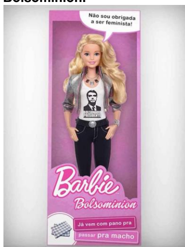
Figura 6. Meme Barbie Bolsominion.

Apenas em 17 de setembro de 2018 a página postou um meme diretamente sobre política. A Barbie Bolsominion fazia alusão aos seguidores de Jair Bolsonaro, incluindo inclusive a frase “Não sou obrigada a ser feminista” repetida dentro das redes sociais por apoiadoras do candidato (Figura 6). A postagem obteve 4.308 compartilhamentos e 5.500 reações.