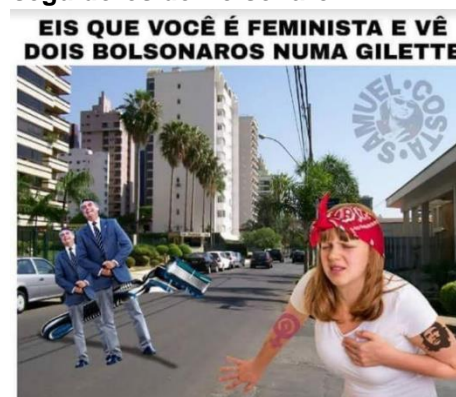
Figura 3. Meme produzido por seguidores de Bolsonaro.

O humor segue esse processo e as produções advindas do grupo de apoio a Bolsonaro tomam formatos de preconceito e ofensa ao pensar diferente (Figura 3). Este tipo de humor segue até o final do pleito, em 31 de outubro.