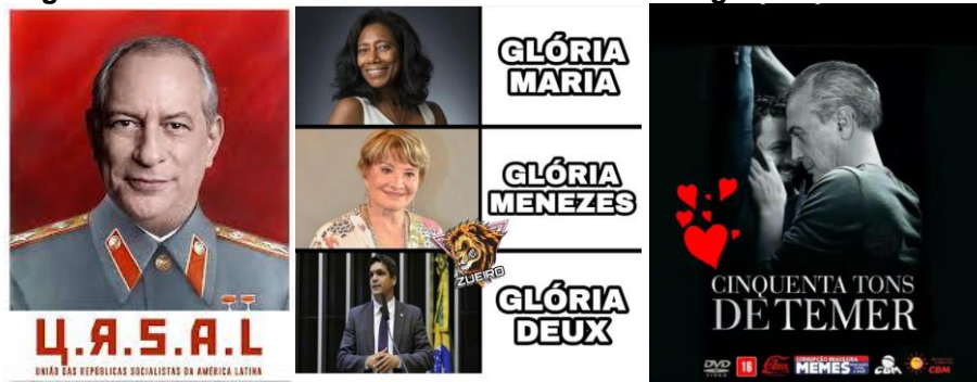
Figura 1. Memes do debate na TV Band em 09 de agosto de 2018.

Alckmin (Partido da Social Democracia Brasileira, PSDB), Guilherme Boulos (Partido Socialismo e Liberdade, Psol) e Marina Silva (Rede) o debate era o primeiro contato entre os candidatos já determinados e o público. Uma série de memes movimentou as redes durante o debate e na semana posterior, destacando-se URSAL , Glória a Deux e Cinquenta tons de Temer .