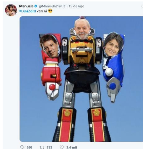
Figura 2. Meme “LulaZord”.