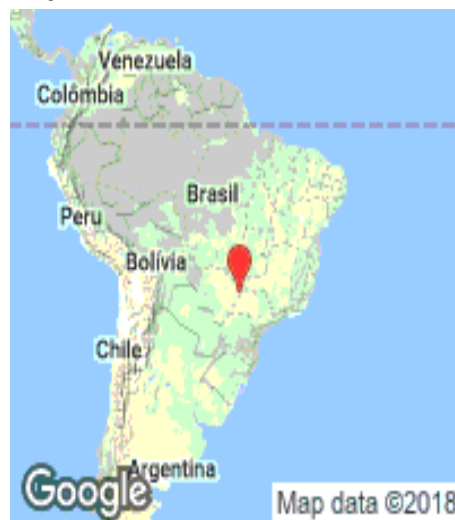
Figura 1. Localização de Selvíria no mapa.