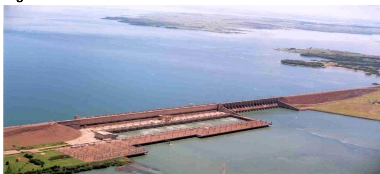
Figura 2. Hidrelétrica de Ilha solteira.

Enquanto isso, a empresa de rações deve inaugurar no início de 2019 sua unidade especializada na produção de artigos para pets no município. A localização estratégica, na divisa com São Paulo, também atraiu as empresas, uma delas é uma empresa que fabricam calçados e a outra produz uniformes para grandes empresas do país (PERES, 2017). Desde janeiro de 2017, Selvíria começou a receber os impostos da usina hidrelétrica e com isso, Selvíria tem 5º maior PIB per capita do Brasil, aponta IBGE, conforme dados do portal de transparência (MARQUES, 2017). A Figura 2 demonstra a Hidrelétrica de Ilha Solteira.