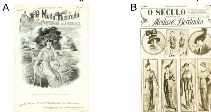
Figura 2. Os primeiros suplementos de modas e bordados no Brasil (primeira década do século XX).

A – Edição no 1128 de Moda Illustrada. B – Edição no 98 de O Século.