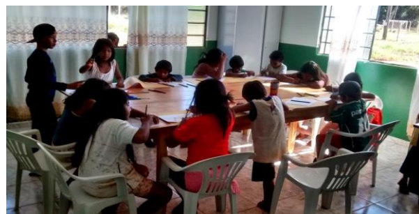
Figura 4. Alunos índios Ofaiés da aldeia fazendo atividades em sala de aula.

Fonte: Extraído do Blog Carlito Dutra ( http://carlitodutra.blogspot.com/2018/05/para-as-artesas-da-alma-silvia-e-heloisa.html ).