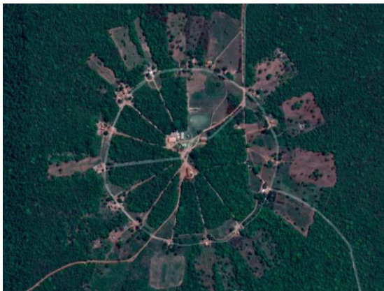
Figura 3. Vista aérea da aldeia indígena Ofaié, situada no município de Brasilândia, MS.