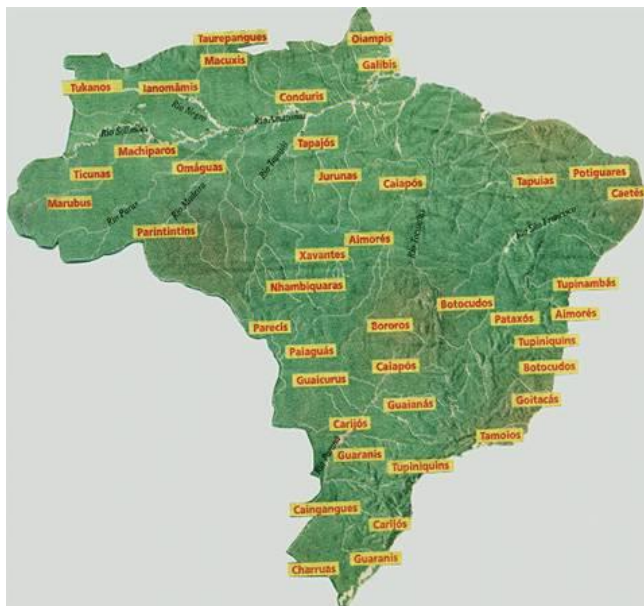
Figura 1. Localização das tribos indígenas no território brasileiro.