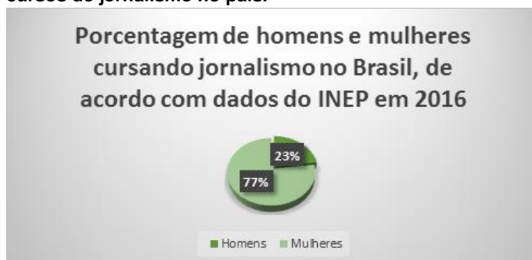
Gráfico 1. Quantidade de acadêmicos matriculados em cursos de jornalismo no país.

Com base em pesquisas feitas pelo INEP em 2016, a porcentagem de mulheres no curso de jornalismo está em cerca de 77%, divididas em cor e raça, sendo elas: brancas, pardas, pretas e indígenas.