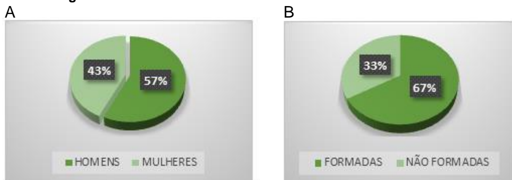
Gráfico 5. Números relativos de colaboradores e formados da prefeitura da cidade de Três Lagoas.

A – número relativo de colaboradores. B – número relativo à formação acadêmica.