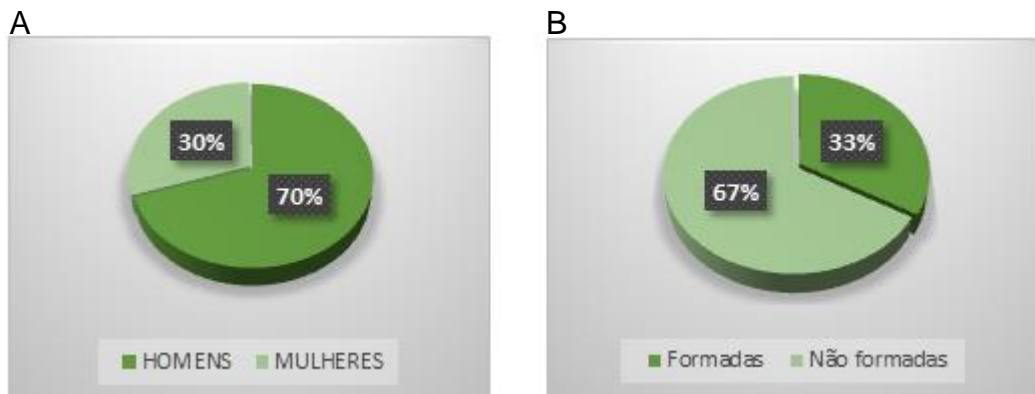
Gráfico 4. Números relativos de colaboradores e formados das rádios Cultura FM e Band.

A – número relativo de colaboradores. B – número relativo à formação acadêmica.