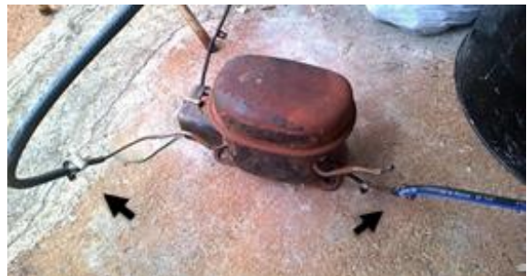
Figura 2. Motor compressor.