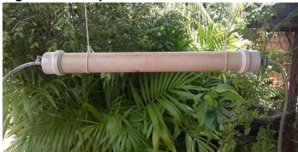
Figura 3. Filtro para retira do ácido sulfídrico.

realizado pela passagem do gás metano por um tubo PVC de 50 mm com dois CAP isolados por anéis Óring de borracha evitando vazamentos, conforme mostra a Figura 3.