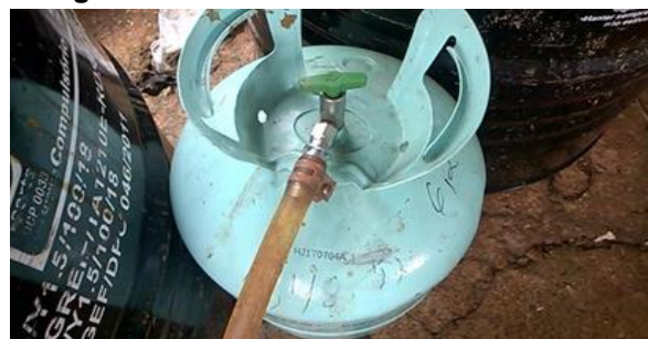
Figura 6. Botijão com adaptador 3/8 para mangueira.