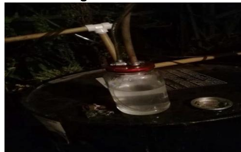
Figura 4. Borbulhador – frasco de vidro com água e amônia.