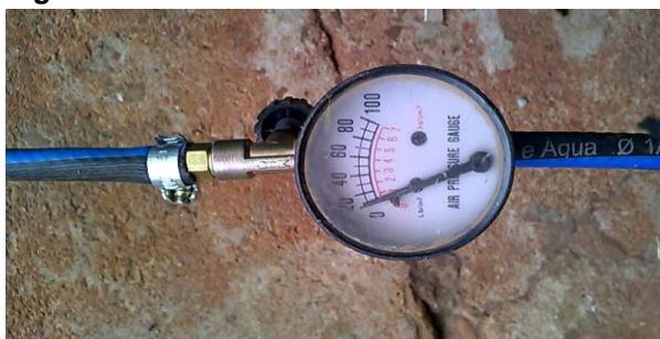
Figura 5. Manômetro.

Também foi instalado um manômetro de 100 psi juntamente com uma válvula reguladora de pressão para controlar a quantidade de gás envazado, como mostra a Figura 5.