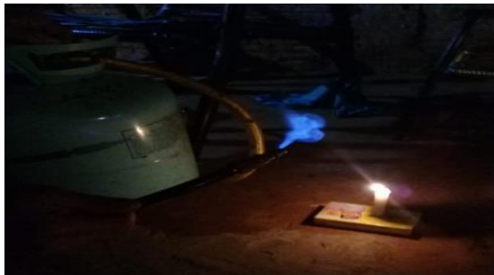
Figura 7. Queima do gás metano.

86 litros de metano, como pode ser verificado na Figura7.