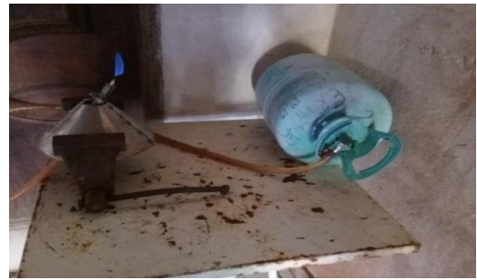
Figura 8. Teste de queima.