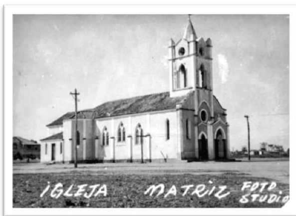
Figura 1: Antiga Igreja Matriz (1940).

Todavia, na segunda metade do século XX, na década de 1950, foi construída a terceira versão da Igreja Matriz. Esta construção não interferiu nos serviços ecumênicos, pois suas paredes foram construídas em torno da versão antiga (Figura 2) deixando-a enclausurada, sendo a edificação antiga demolida em 1959, após a conclusão da construção da nova Catedral (BASTOS et al. , 2015).