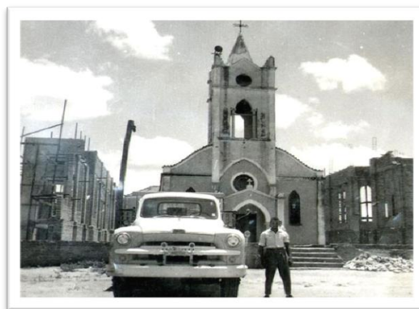
Figura 2: Construção da nova Igreja Matriz (Catedral Sagrado Coração de Jesus) em 1958.