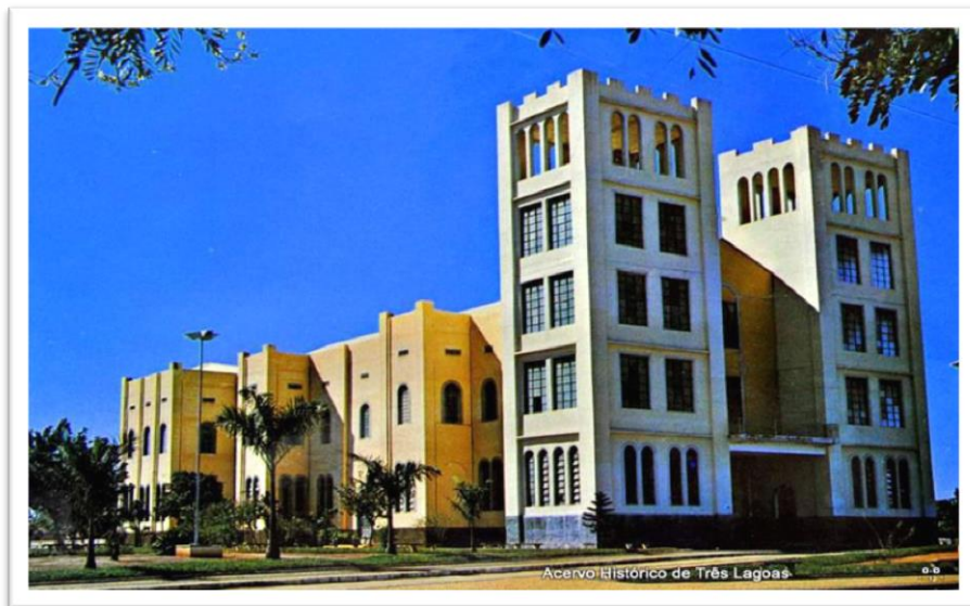
Figura 3: Catedral Sagrado Coração de Jesus, Três Lagoas (MS) (década de 90).

Ainda segundo os autores, essa terceira versão da Igreja Sagrado Coração de Jesus (Figura 3) caracterizava-se por uma estrutura massiva e apresentava traços da Arquitetura Românica a uma primeira vista. Entretanto, suas ameias remetiam à Arquitetura Gótica italiana, bem como sua rosácea compreendia uma característica da Arquitetura Gótica francesa. Caracterizando-se, tradicionalmente, por apresentar duas torres, uma destas abrigando o sino. Seu interior, por sua vez, possuía elementos do primeiro período da Arquitetura gótica inglesa, esta última também influenciada pela Arquitetura Românica. As esculturas e outros ornamentos da Igreja Sagrado Coração de Jesus possuíam influência cubista.