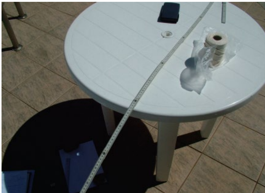
Figura 2 – Aparato experimental. Repare o feixe de luz sobre o papel e o furo na mesa.