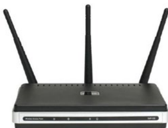
Dlink- Extreme N

O IEEE 802.11N por enquanto não esta sendo usado para uso em provedores (outdoor) por causa a necessidades de usar de três antenas.