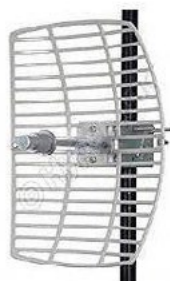
Antena de Grade 5 GHz