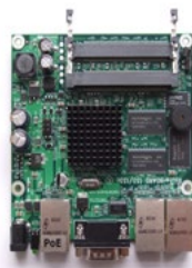
RouterBoard Cartão 5 GHz