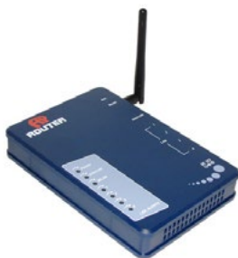
WISP 2.4 GHz

Como esse equipamento não precisa ficar próximo ao computador, são geralmente instalados mais próximos da antena assim diminuindo o tamanho do cabo coaxial usado, e assim ganho mais qualidade no sinal captado.