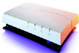
AP-2000 2.4 GHz

IEEE 802.11B e IEEE 802.11G 2.4 GHz, atualmente dois padrão geralmente vem integrado junto no mesmo equipamento, podendo escolher se vai transmitir no padrão B ou G, ou no os dois ao mesmo tempo.