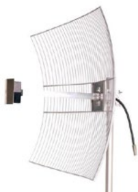
Antena de Grade 2.4 GHz