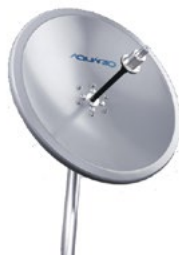
Antena de Disco 5 GHz