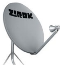
Off-set (mini parabólica)