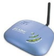
AP-5000 5 GHz

IEEE 802.11B e IEEE 802.11G 2.4 GHz, atualmente dois padrão geralmente vem integrado junto no mesmo equipamento, podendo escolher se vai transmitir no padrão B ou G, ou no os dois ao mesmo tempo.