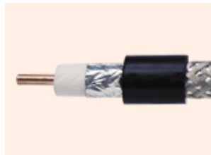
Cabo coaxial RGC 58

Há uma outra solução para o modo clientes que são os AP Clientes, que são equipamentos parecido com as APs, que são usados em modo cliente (receber sinal), e se conectado ao computador com padrão ethernet ( palca de rede), esses equipamentos tem um mini sistema operacional interno com varias funções, entre elas o NAT (compartilhamento) e roteamento.