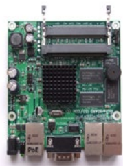
RouterBoard Cartão 5 GHz