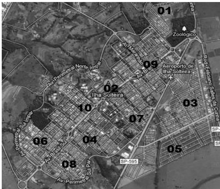
Figura 2. Pontos de coleta

ultrapassar o valor de 500 unidades formadoras de colônia/mL (UFC/mL). Enquanto que as amostras que não apresentarem número mais provável (NMP) de coliformes totais e termotolerantes por 100 mL foram consideradas potáveis.