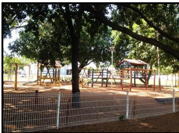
Figura 7: “Parquinho” da Lagoa Maior.

“Hoje qualquer horário que se vai na lagoa tem que ficar atento, os “bandidinhos” estão por toda parte” (A.G.).