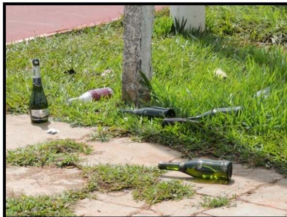
Figura 13: Garradas espalhadas na Lagoa.

Indagada as expectativas futuras para a lagoa maior. Todos apresentaram de alguma forma esperanças, almejam um ambiente melhor, com aprimoramentos em toda sua infraestrutura, desde o fundo da lagoa até a folha no topo da árvore, como: implantação de ciclovia, reforma nas pistas de esportes e de saúde, preservação do biossistema, manutenção, fiscalização e policiamento adequado.