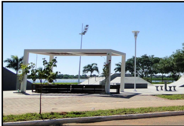
Figura 2: Pista de Skate construída no 1ª mandato de Simone Tebet.

A partir do governo da até então prefeita municipal Simone Tebet (2004), houve uma modernização no entorno da lagoa. Com a construção de áreas novas como o centro poliesportivo, academia ao ar livre, pista de Skate, instalação de um chafariz dentro da lagoa, iluminação, entre outros aspectos modernizados (ver Figura 2).