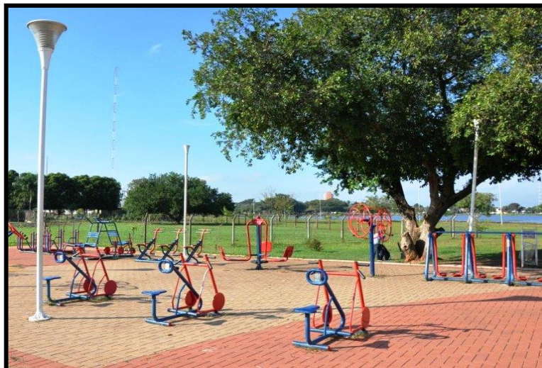
Figura 11: Academia ao ar livre.

Questionada a situação dos recursos naturais a grande maioria teve opiniões parecidas, ressaltaram que é preciso sempre buscar melhorias, acredita-se que a lagoa poderia estar muito melhor do que se vê hoje, a falta de conscientização das próprias pessoas que a utilizam contribuem diretamente com o acúmulo de lixo e vandalismo que se instala no local por consequência também da ausência de atenção do poder público, fiscalização, manutenção e orientação para preservação do espaço natural (ver Figura 12 e 13).