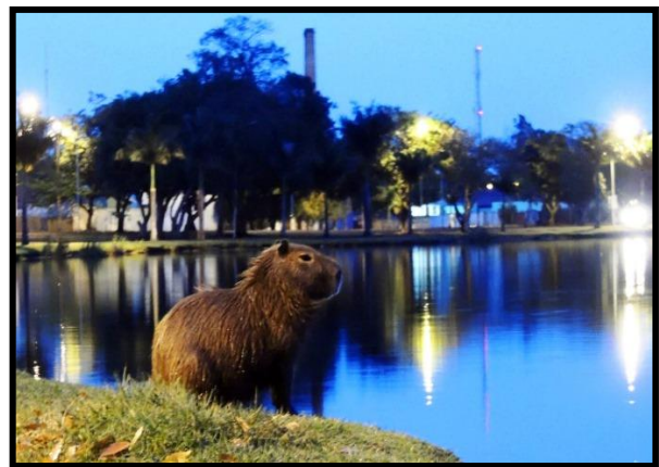
Figura 4: Animais presentes na Lagoa Maior.