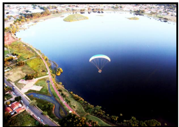
Figura 6: Imagem aérea da lagoa e seu entorno.