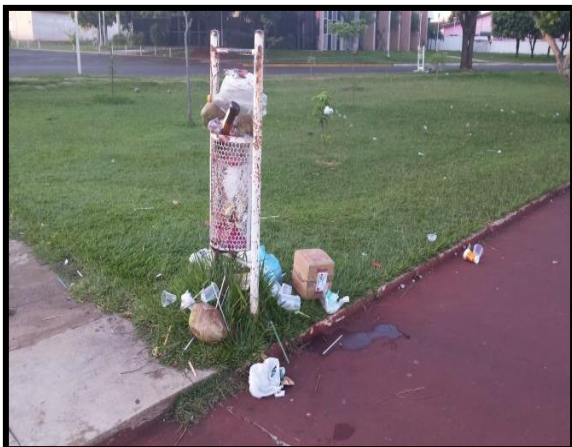
Figura 12: Fotos de lixo acumulados na lagoa.