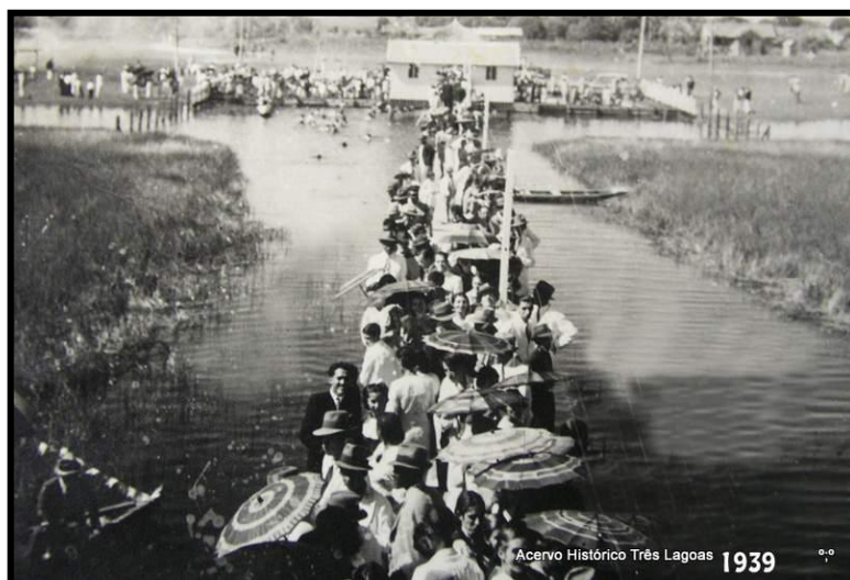
Figura 1: Balneário da Lagoa Maior em 1939.

No início do século, entre 1902 e 1905, cerca de 700 pessoas se estabeleciam nos arredores da Lagoa Maior. Já havia alguns estabelecimentos comerciais. Diversas benfeitorias surgiram em função da venda de gado, considerado o primeiro ciclo econômico da região. A Lagoa maior teve seu início urbanístico como um balneário, chamado “Balneário da Lagoa” (ver Figura 1).