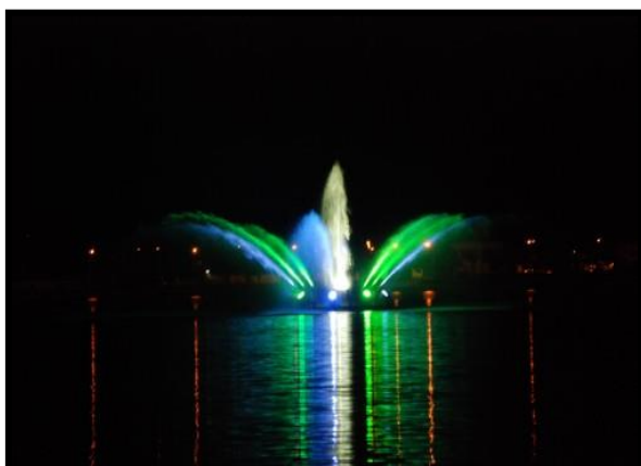
Figura 9: Fonte Luminosa na Lagoa Maior.