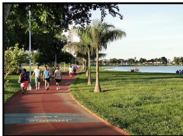
Figura 8: Pista de caminhada – Lagoa Maior.