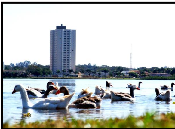
Figura 3: Patos na lagoa Maior

“As manhãs frescas e o entardecer neste lugar são incríveis” (T.S.).