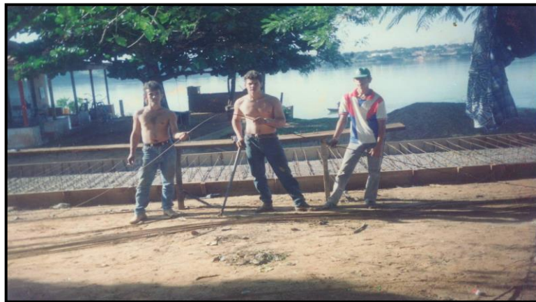
Figura 09: Vista parcial da varanda do Restaurante Mato-grossense e do rio Paraná quando estava sendo construída a balança do posto de fiscalização estadual no Porto João André na década de 80.

“Nós não podemos ir lá, mas pessoas de fora vão e não se ouve falar que foram punidos”.