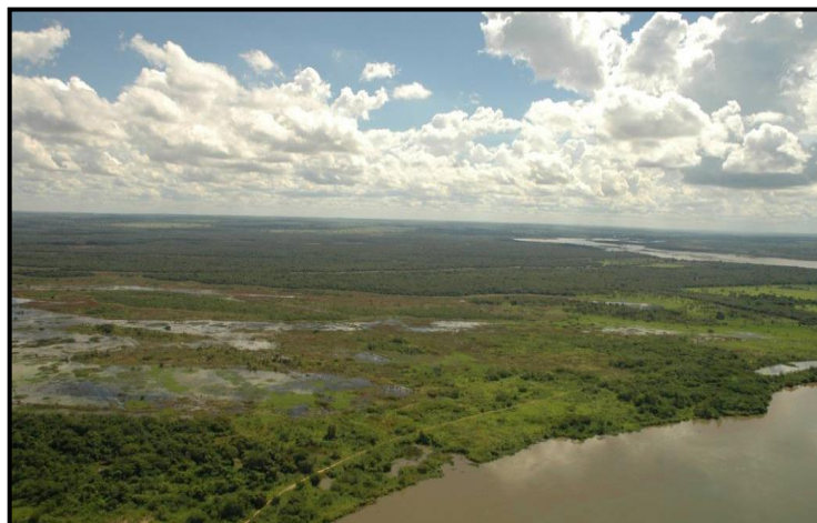
Figura. 02: Vista panorâmica da Reserva Cisalpina a partir do rio Paraná, próximo à foz do rio verde.

Por exigência do IBAMA, a fazenda Cisalpina foi transformada em Reserva Particular de Patrimônio Natural (RPPN). Por meio da renovação da licença de operação 121/01 em três de maio de 2002, cuja condicionante 2.4 determinou que a CESP implementasse “ações para transformar a Fazenda Cisalpina em Unidade de Conservação” (Figura 2).