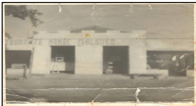
Figura 07: Restaurante da mamãe Dolores, no Porto João André, às margens do rio Paraná.

“Aqui é bom pra estudar os filhos e temos médicos de vez em quando, mas mesmo assim eu gostava mais de lá”.