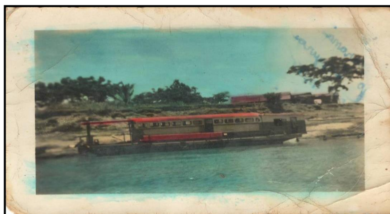
Figura 08: Balsa a vapor usada no transporte de passageiros na década de 70. Muito citada como causadora de grandes lembranças na memória do povo. As casas da margem são do Porto João André.