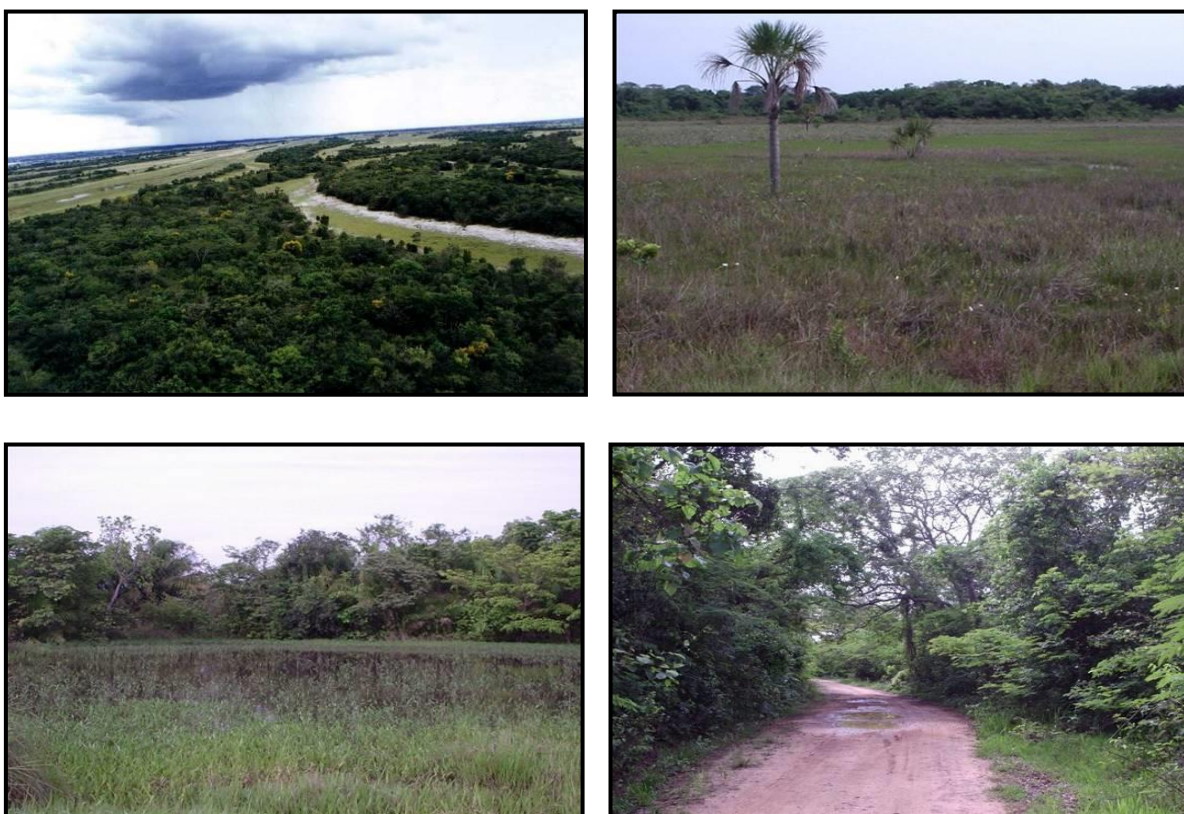
Figura 03: Aspectos das diferentes fisionomias vegetais da Reserva Cisalpina.

A Reserva tem um bioma de mosaico de floresta estacional decidual aluvial, savana arbórea (cerradão), savana (cerrado) e campos de várzea (Figura 03).