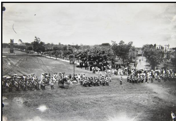
Figura 3: Manifestação Cívica no entorno da Praça da Bandeira em 1937.