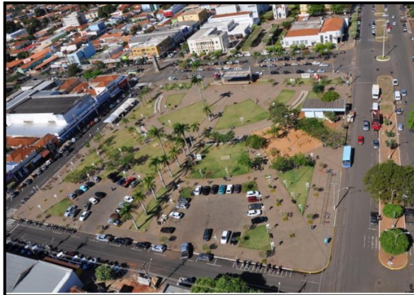
Figura 8: Vista aérea atual Praça Ramez Tebet.