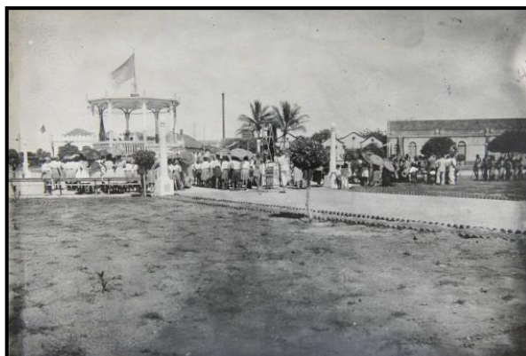
Figura 7: Manifestação cívica no segundo coreto da Praça, inaugurado em junho de 1948 – Fotografia dos anos 1950.