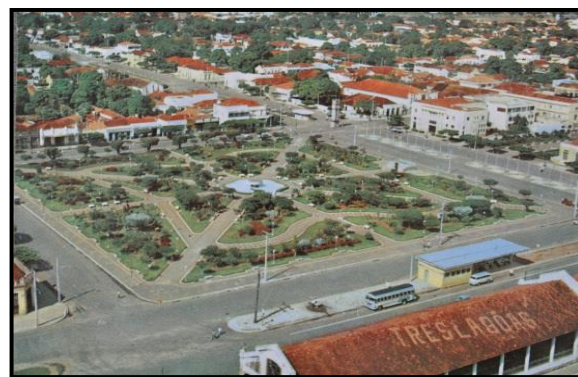
Figura 1 e 2: Antiga Praça da Bandeira.

Alguns locais da cidade de Três Lagoas – MS, como atualmente a Praça Ramez Tebet poderiam ser patrimônios históricos e ponto turístico da cidade, uma vez que a mesma foi transformada e modernizada, alterando e contrapondo a história e lembrança dos moradores locais. Nas palavras de Camargo (2004, p.12),