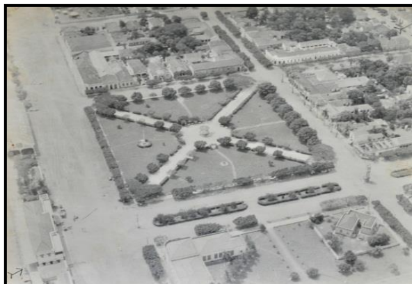
Figura 4: Vista Aérea da Praça da Bandeira em 1940.