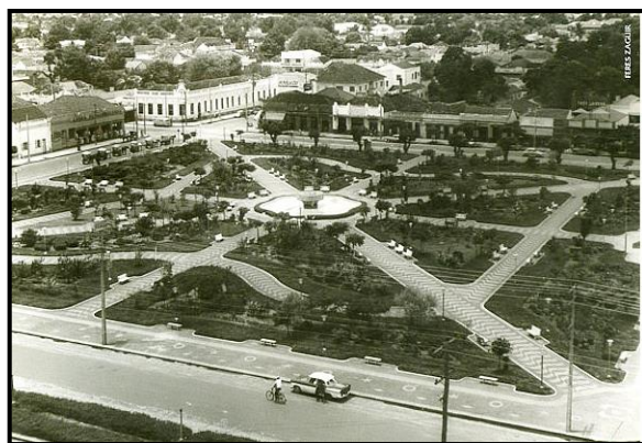
Figura 6: Praça da Bandeira após sua inauguração em 1965.