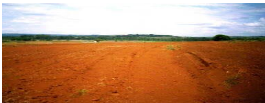
Figura 1. Solo Arado e Gradeado.

crescimento da planta em sua fase inicial causando assim uma baixa produtividade. Para que tenhamos um bom preparo do solo na área a ser cultivada, precisamos de máquinas e equipamentos adequados para a preparação do mesmo, temos então uma preparação para o plantio da cultura a ser trabalhada muito adequada para uma boa sementeira. Precisamos como base inicial deste tipo de manejo para o preparo de solo até o plantio máquinas e equipamentos adequados (CRUZ, 2014a). Abaixo a Figura 1 demonstra uma área preparada para o plantio convencional.