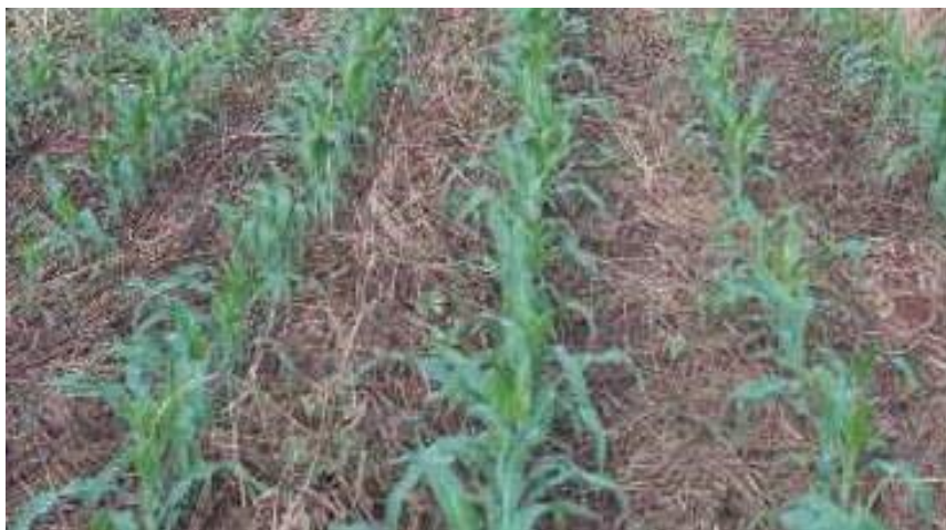
FIGURA 2. Sistema de Plantio Direto de Milho.

O Sistema de Plantio Direto – SPD tem sido uma técnica de conservação dos solos e conseqüentemente com uma maior produtividade em suas cultivares, obteve um aumento significativo a partir do ano de 1990, e já é uma prática bastante desenvolvida entre grandes e médios produtores. A Figura 2 abaixo demonstra o sistema de plantio direto de milho (CRUZ et al., 2014b).