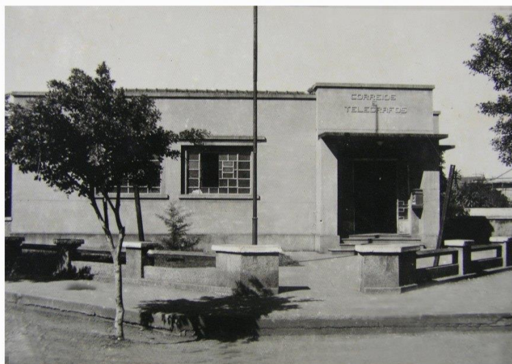
Figura 10. Antigo Correio e Telégrafo. Três Lagoas – MS.

O Correio Telégrafo (Figura 10) é uma das instituições mais antigas da nossa cidade, se tornou um dos mais importantes meios de transmissão de mensagens e notícias, ele nos trouxe a facilidade na comunicação e fez com que Três Lagoas desse um passo a caminho da grande evolução que ainda estava por vir. Com essa chegada houve uma evolução das formas de envio de mensagens, é o meio mais barato e de fácil acesso para maioria da população.