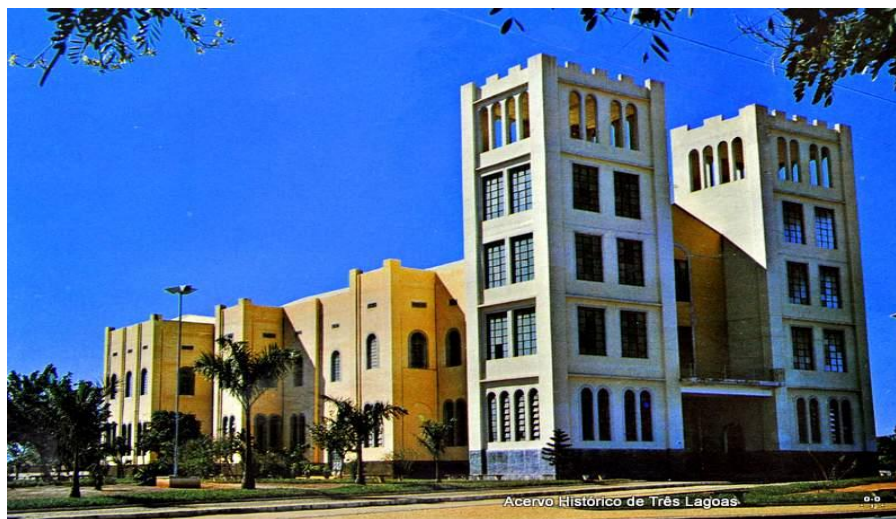
Figura 9. Igreja Matriz - Três Lagoas – MS.

historia na cidade não foi possível encontrar imagens anteriores a segunda versão, a versão apresentada na Figura 9 é a segunda que foi erguida do lado de fora da primeira igreja, e somente quando estava já de pé foi o prédio antigo demolido.