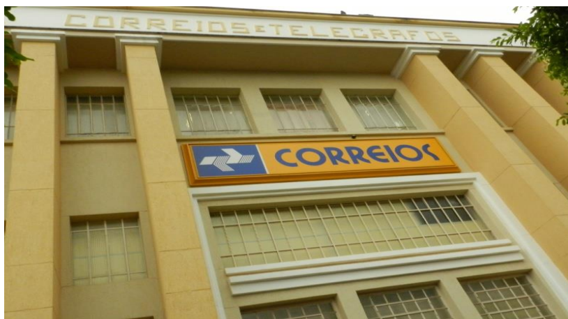
Figura 11. Correio e Telégrafo Três Lagoas – MS.

O centro principal de Três lagoas formou-se no início do século XX, contíguo à estação ferroviária da estrada de Ferro Noroeste, juntamente com a praça e uma igreja. Atualmente se caracteriza como uma centralidade intensa, que movimenta os mais diversos setores da cidade; se constituiu um nó na malha urbana, que além de exercer um papel de fornecedor de serviços e comércios variados, interliga diversos setores da cidade. Com isso, essa área central, mesmo com a criação de outros centros comerciais, constituiu-se na principal centralidade do espaço urbano três-lagoense. O coreto era o local também onde crianças se reuniam para fazerem coral (Figura 12).