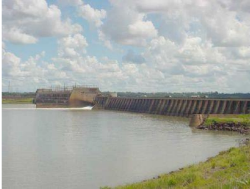
Figura 4. Usina Hidrelétrica Jupia – Divisa entre as cidades de Três Lagoas – MS e Castilho – SP.

Sabe-se que o crescimento populacional precisa de um grande começo, como dito anteriormente a linha férrea foi o que deu um inicio a historia, Figura 5, mostra o local antes da construção da ponte férrea Francisco de Sá.