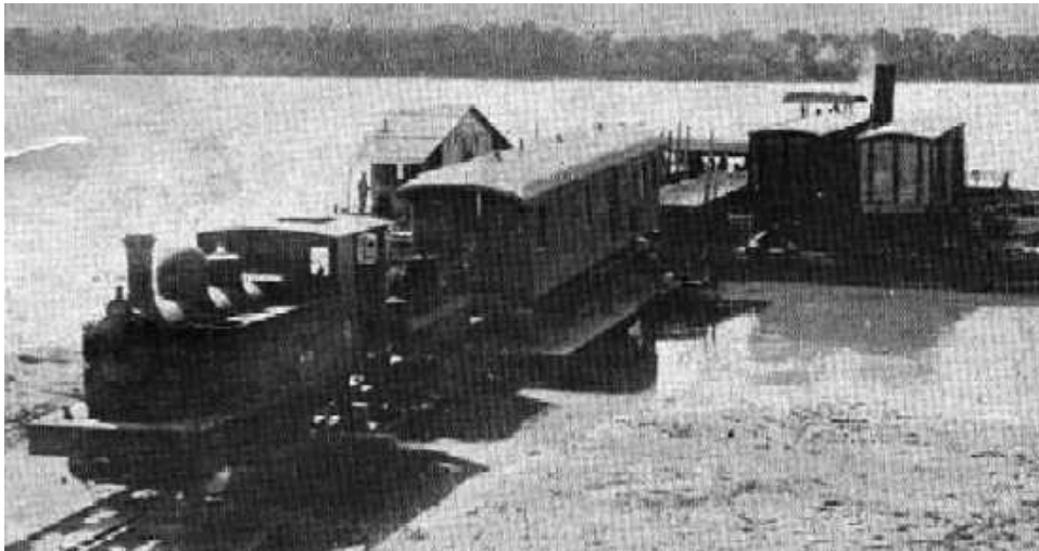
Figura 5. Anterior a construção da Ponte Francisco de Sá . Três Lagoas – MS.

Sabe-se que o crescimento populacional precisa de um grande começo, como dito anteriormente a linha férrea foi o que deu um inicio a historia, Figura 5, mostra o local antes da construção da ponte férrea Francisco de Sá.