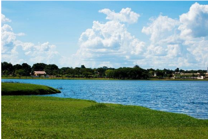
Figura 2. Lagoa Maior – Antiga Casa da Bomba. Três Lagoas – MS.

Na Figura 2, fotografada sob o mesmo ângulo que a figura 1, pode se notar uma melhoria significativa.