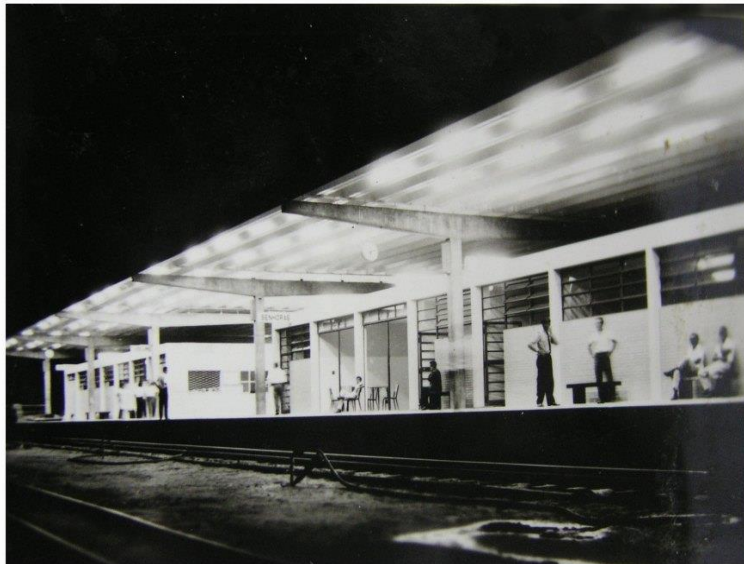
Figura 7. Estação Ferroviária. Três Lagoas – MS.

exemplo, de Três Lagoas MS para Andradina-SP. Os trens eram divididos em classe A e B, na qual eram de madeira ou revestidos de almofada.