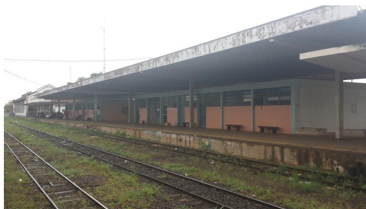
Figura 8. Estação Ferroviária Três Lagoas – MS.

Através da Figura 8, fotografada sob o mesmo ângulo que a Figura 7, que não houve mudanças estruturais sendo mantidas intactas até hoje, exceto pelo fato que agora os trens transportam cargas de empresas autorizadas e não mais passageiros.