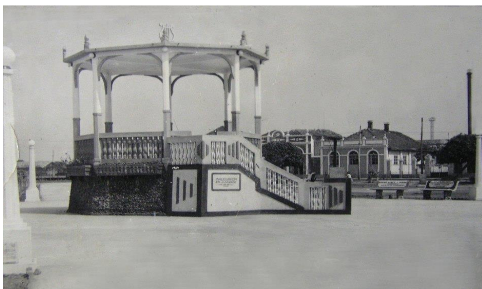
Figura 12. Coreto da Praça Central Três Lagoas – MS.

O centro principal de Três lagoas formou-se no início do século XX, contíguo à estação ferroviária da estrada de Ferro Noroeste, juntamente com a praça e uma igreja. Atualmente se caracteriza como uma centralidade intensa, que movimenta os mais diversos setores da cidade; se constituiu um nó na malha urbana, que além de exercer um papel de fornecedor de serviços e comércios variados, interliga diversos setores da cidade. Com isso, essa área central, mesmo com a criação de outros centros comerciais, constituiu-se na principal centralidade do espaço urbano três-lagoense. O coreto era o local também onde crianças se reuniam para fazerem coral (Figura 12).