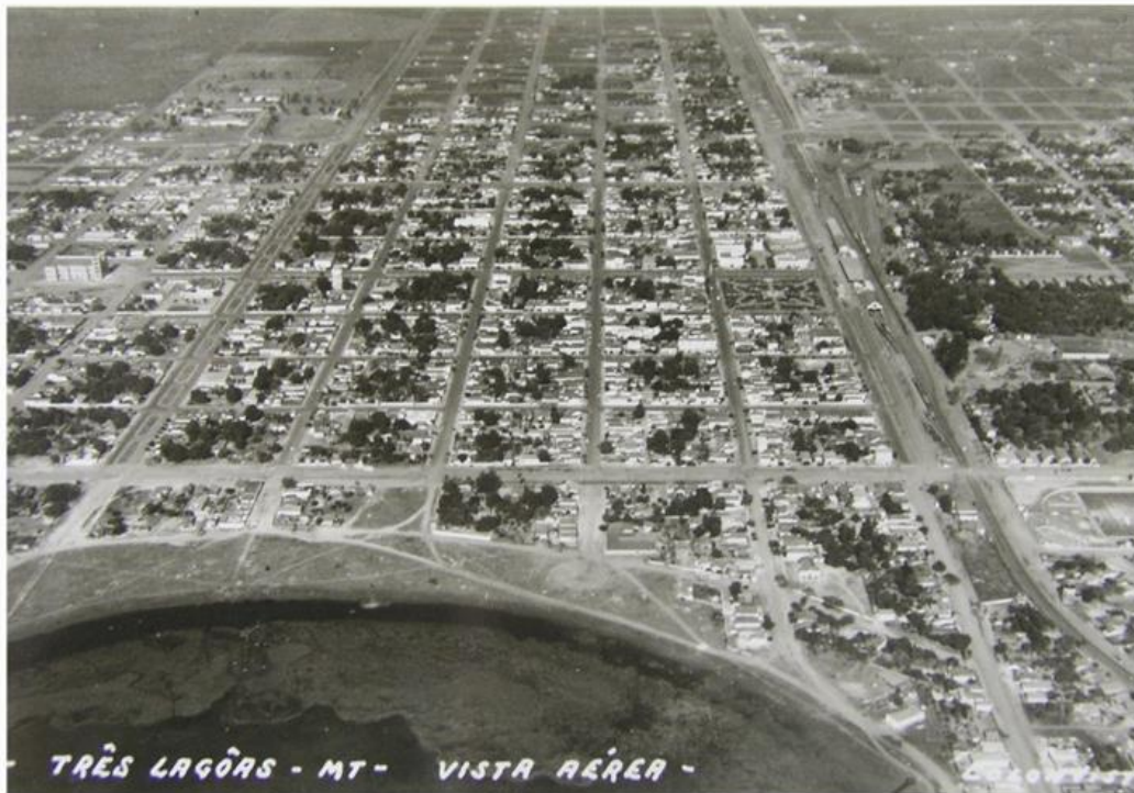
Figura 3. Vista aérea da cidade. Três Lagoas – MS.

Na época, Três Lagoas foi considerada uma cidade moderna com ruas e avenidas largas, porém não tinha energia elétrica. A cidade não parava de crescer. Gente chegava de diversos lugares: cidades, estados e outros Países; diversas construções: pontes, armazéns padarias, hotéis, bares, hospitais, escola e segunda igreja (igreja Sagrado Coração de Jesus, no eixa da avenida principal).