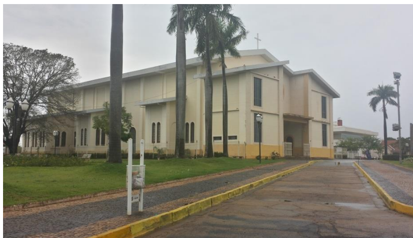
Figura 8. Igreja Matriz – terceira versão. Três Lagoas – MS.

A Igreja Matriz como atualmente, é a terceira versão (Figura 8), foi modificada perdendo as duas torres que havia, após passar por uma reforma no ano de 2001, houve uma grande descaracterização da mesma, passando a ter uma aparência de galpão, assim todos aqueles seus traços antiguidade foi deixada para trás, acreditasse que as pessoas possam sentir falta dessa antiguidade não deixando de lado a fé que seria o primordial, entretanto a fé vem junta com uma cultura que é deixada para a gerações.