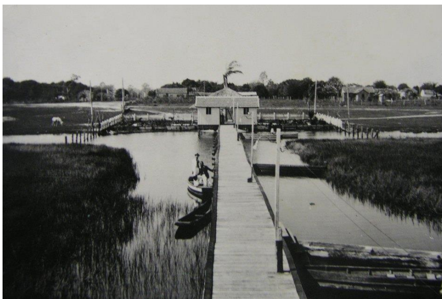
Figura 1. Lagoa Maior – Antiga Casa da Bombas. Três Lagoas – MS.

Nas condições em que se realizaram este estudo e pelos dados apresentados nas figuras a seguir, observa-se que o crescimento populacional de Três Lagoas ocasionou alterações físicas e ambientais visíveis, principalmente em seus monumentos históricos, que em alguns casos ainda carregam consigo as mesmas características dos anos passados.